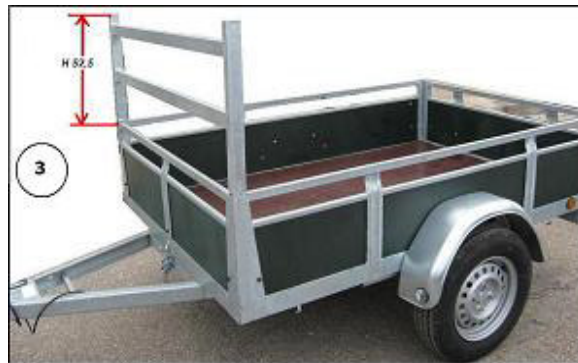
3 POSE DU PORTE ECHELLE A L'AVANT DE LA REMORQUE ( Si votre Remorque est déjà équipé d'un porte echelle , verifier que la hauteur corresponde au Rehausse AR )